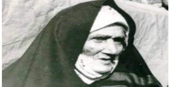
(Halide Edip Adıvar)